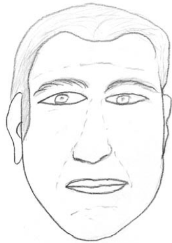
Rozdíl v kreslení před a po kurzu jsou obrovské...